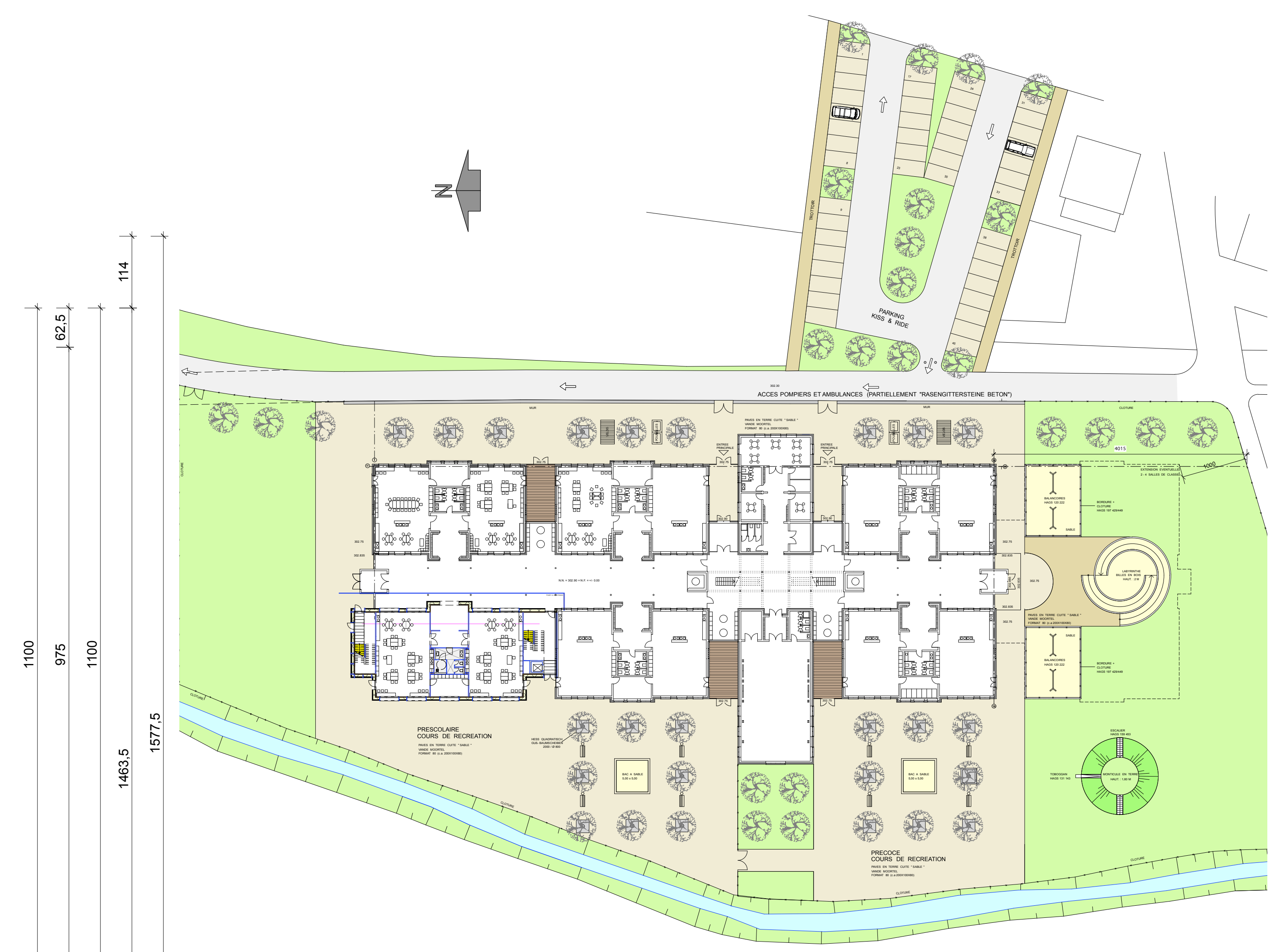
PLAN DE SITUATION - 1/500 PHASE 1A