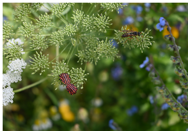
Koriander mat Sträifewanzen an enger friddlecher Feldharespel

Coriandre avec Punaise Arlequin et une Guêpe poliste, non offensive