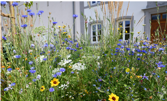
Färber-Meedchenan Coréopsis tinctoria Koriander Coriandre Karblumm Bleuet des champs