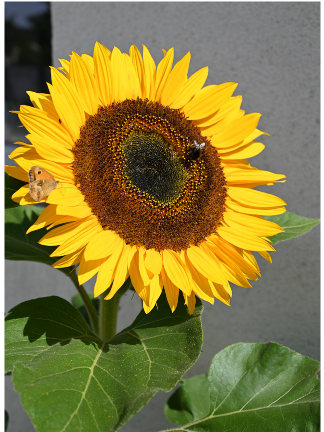
Sonneblumm mat donkeler Äerdbommel an dem Päiperlek "grousst Ochsenan" Tournesol avec Bourdon terrestre et le papillon „Myrtil“